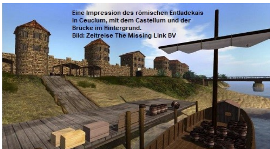
Eine Impression des römischen Entladekais in Ceuclum, mit dem Castellum und der Brücke im Hintergrund.

Das heutige Cuijk liegt auf einem Hochplateau entlang der Maas. Auf diesem sicheren, trockenen Platz wird im zweiten Jahrhundert eine Zivilsiedlung (vicus) errichtet, die sich zu einem regionalen Verwaltungszentrum (civitas) namens Ceuclum entwickelt. Die Probleme der Römer mit den germanischen Nachbarn in der Mitte des dritten Jahrhunderts erfordern eine Neuordnung der Grenzverteidigung. Diokletian, römischer Kaiser von 284 bis 305 n. Chr., lässt eine hölzerne Befestigungsanlage (castellum) auf dem Plateau errichten. Nach 326 n. Chr. wird ein schwerer Entladekai